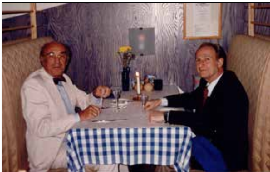
Figura 7 -Cenando en San Diego, California, con el Dr. Roger Guillemin, septiembre de 1993.