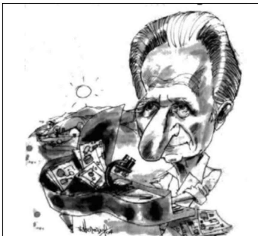
Figura 10 -Así me vio un dibujante de LA GACETA en una nota que el diario tucumano publicó hace unos años.

lle Scienze , San Marino, junio 2012. Presidente Consejo Regional Ingeniería Biomédica para América Latina (CORAL), mayo 1991-dic 1994. 1996: Career Achievement Award of IEEE/EMBS Institute of Electrical and Electronics Engineers/Engineering Medicine and Biology Society . 1999: IEEE Fellow Member; Pontificia Universidad Católica del Perú me designó Profesor Honorario, agosto 1999. Premio Bernardo Houssay 2004, de SECYT, Trayectoria Investigación Científica y Tecnológica. Premio Félix Cernuschi a Bioingeniería 2005, Academia Nacional Ciencias Exactas, Físicas y Naturales. He publicado 100 trabajos científicos o tecnológicos en revistas indexadas, 34 en revistas no indexadas, presentado 98 comunicaciones a congresos, publicado 20 artículos de docencia o de puesta al día, 7 capítulos en libros, 4 libros de texto y uno en curso de ser publicado, editor de 6 números especiales de revistas, au-