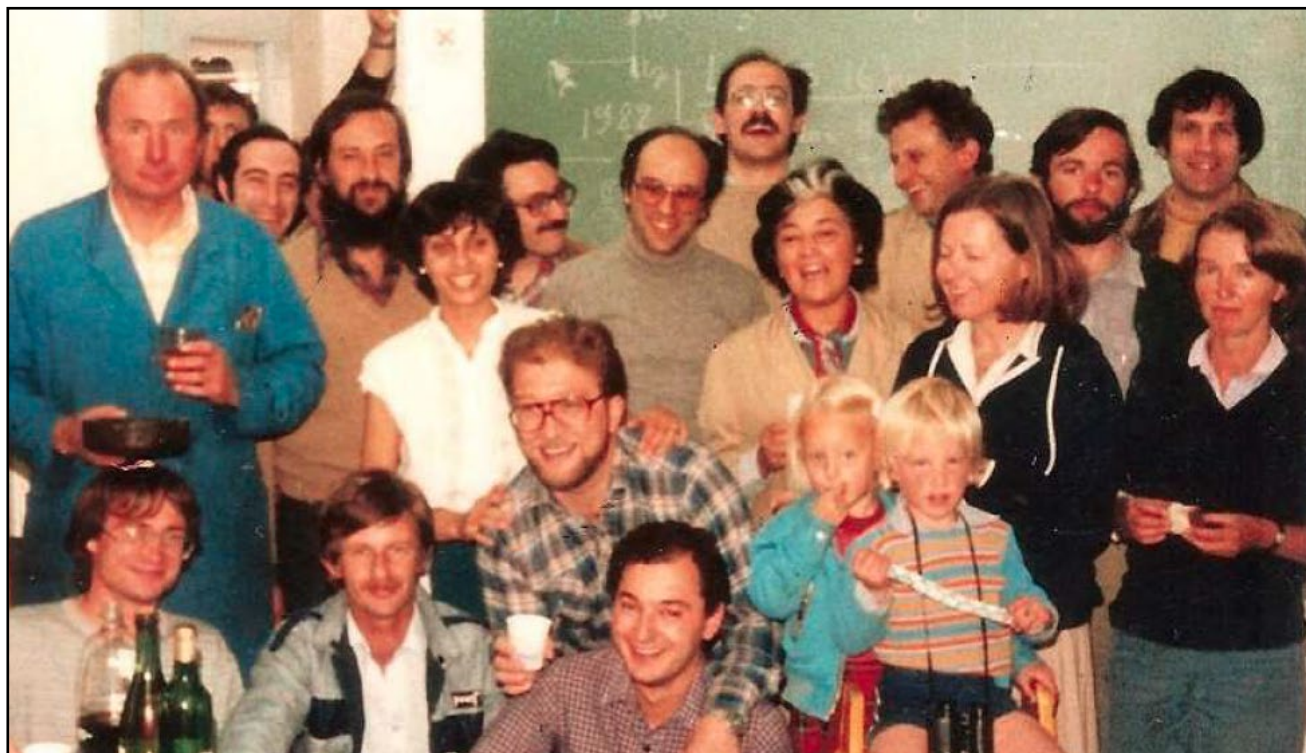
Figura 4: Miembros y allegados al laboratorio de Bajas Temperaturas a fines de los '70.

Paralelamente, en esos años continué con el estudio de la fenomenología de los compuestos intermetálicos de Ce. Gracias a ello pude correlacionar algunas propiedades, desarrollando un conjunto de conceptos básicos que me siguen siendo útiles para tratar de enten-