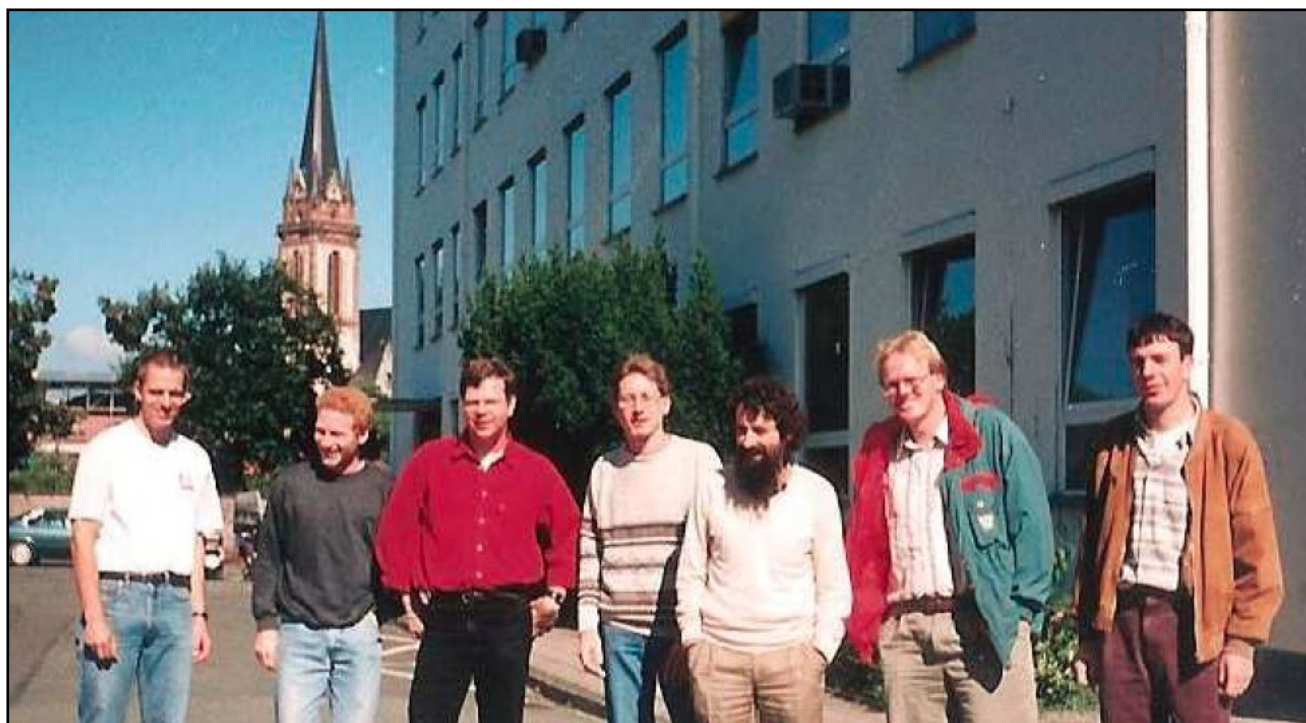
Figura 7: Grupo de la Universidad Técnica de Darmstadt.

A principio de los 90' comenzaron nuevos y motivantes proyectos con colegas europeos, los más fructíferos y sostenidos en el tiempo