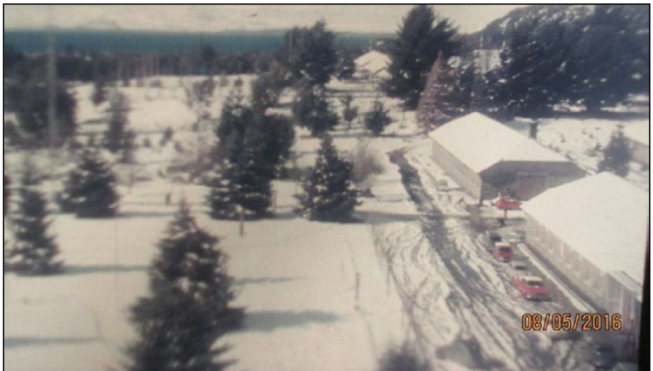
Figura 1: Nevada en el Centro Atómico Bariloche en los años '60.

Fue recién al comenzar mi tesina de licenciatura (o 'Trabajo Especial', equivalente a la actual Maestría) en el Laboratorio de Bajas Temperaturas (LBT) que encontré el carril que me motivaría de ahí en más. Ese