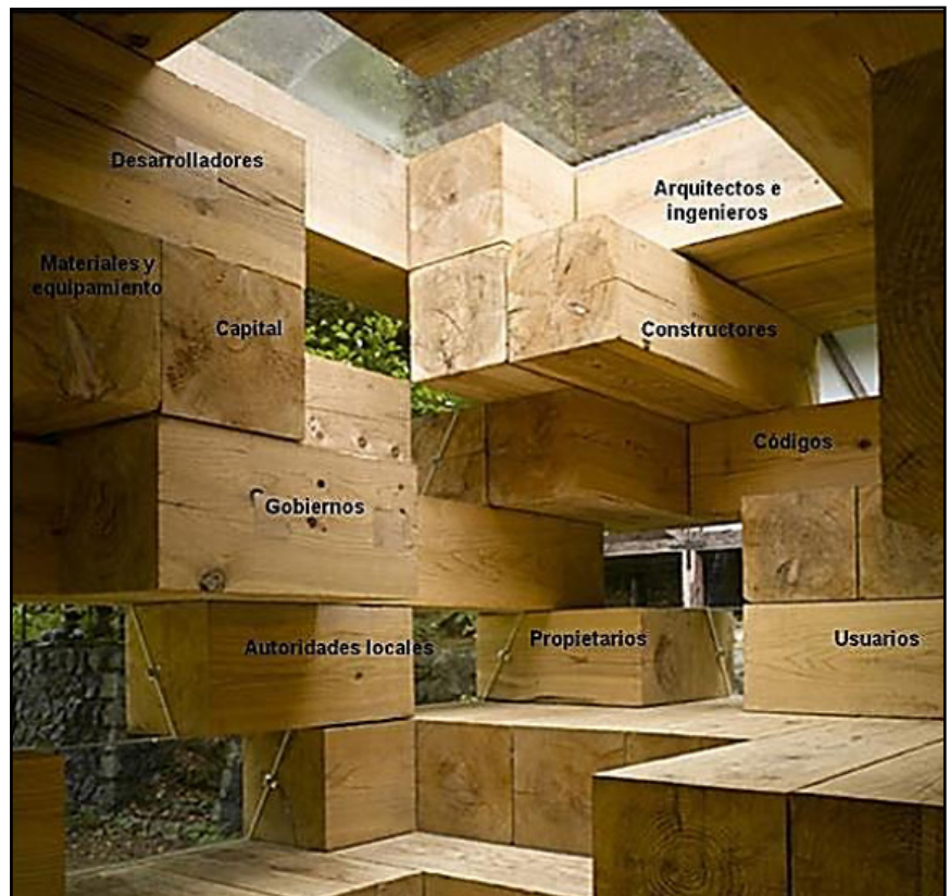
Figura 1: Fragmentación en el sector edificio.

equipos, y otros contratistas (Figura 1). El interés y el conocimiento de los temas energéticos varían considerablemente entre estos actores. Además, el sector de la construcción normalmente sufre de una falta de liderazgo en las mejoras de este tipo de eficiencia. En una recomposición o fusión de esa fragmentación, podemos obtener un modelo más acotado del objeto arquitectónico 1 con su morfología, su tecnología y sus indicadores que pueden ser perfectamente cuantificados, y la física del ambiente con sus condiciones climáticas y el contexto geográfico (Figura 2) 2 . En esta recomposición, la concreción del edificio según las reglas del arte y del buen construir, en una determinada localización geográfica y en un contexto cultural determinado, hay un proceso de diseño que no es lineal: involucra un ida y vuelta, discusión y acuerdos entre los diferentes actores.