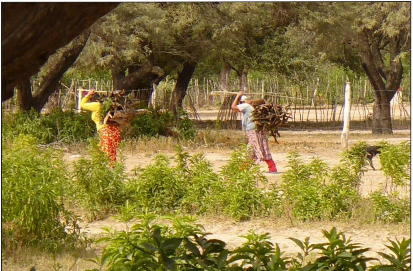
Figura 3. Mujeres toba cargando leña, Vaca perdida (Formosa), 2008.

Mayormente estos grupos han sido clasificados como cazadores y recolectores, eran nómades y en algunos casos también practicaban una agricultura rudimentaria, en tanto que en los límites occidentales del Chaco se despliegan los grupos agrícolas como los guaraníes y chanés. Fuera de esa frontera occidental, actualmente en muchas poblaciones siguen recolectando frutos del mon-