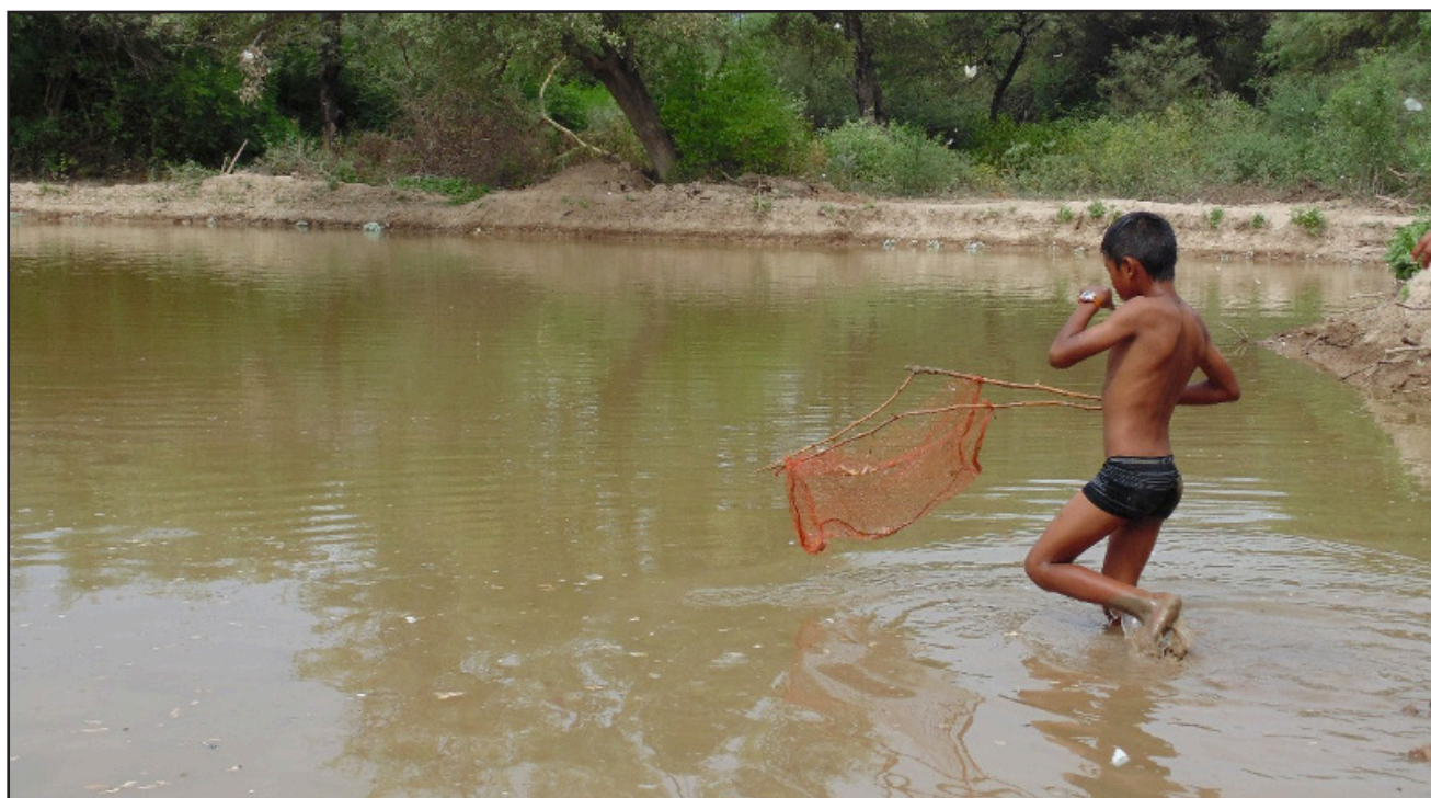
Figura 4. Joven chorote pescando con red, Misión La Paz (Salta), 2016. M. A. Morando.

La recolección sigue siendo importante, en el monte no solo se buscan alimentos, sino que a ello se suma la recolección de elementos para generar tintes, a veces algún producto que se utiliza con fines medicinales e, inclusive, algunas mujeres, como las tobas del oeste de la provincia de Formosa (Argentina) esquilan ovejas ajenas con el permiso de sus dueños, para tener lana y realizar labores, que luego serán vendidas tanto organizándose de forma grupal como también de forma individual. Asimismo, era, y en algunos casos sigue siendo importante, la recolección de chaguar ( Bromelia spp. ), materia prima con la que fabrican el hilo que emplean para confeccionar bolsas tanto femeninas como masculinas 9 , así como redes de pesca, etc. Con esos