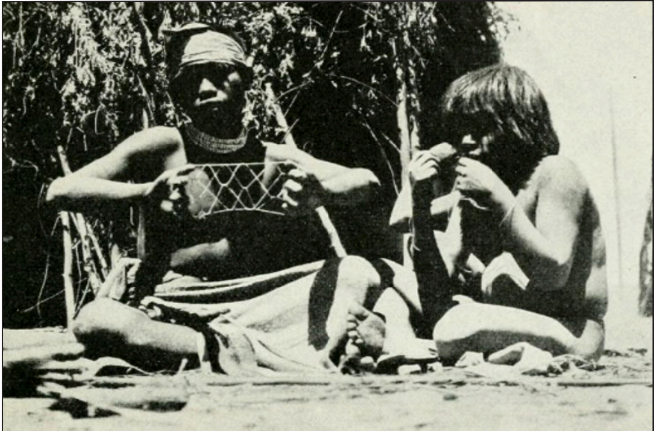
Figura 5. Juegos de hilo entre los chorotes. E. Nordenskiöld, Indianerleben , 1912.

De todas maneras, no habría que suponer una homogeneidad total a lo largo del Gran Chaco a nivel geográfico ni humano. No obstante, a los fines de este escrito debemos intentar una mirada que los contenga, pero a la vez, debemos hacer