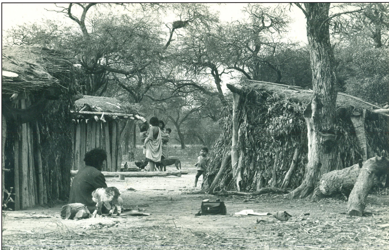
Figura 6. 'Un -wet, 'lugar' o 'caserío', de wichí montaraces. Fotografía tomada por John H. Palmer en la década de 1970, en el departamento de Rivadavia, Salta'.

referencia a que si nos enfocamos y puntualizamos en cada uno de los grupos chaqueños veremos que existen particularidades y matices. A todo ello se suman tanto las persistencias, como la dinámica y cambio constantes que se producen en este vasto territorio, que hacen estallar cualquier esquema que, como este, siempre es provisorio o, simplemente, preliminar.