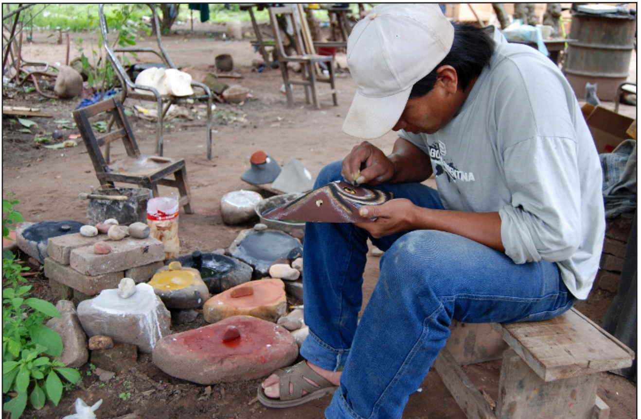
Figura 2. Artesano chané pintando máscaras de yuchán ( Ceiba chodatii ), Campo Durán (Salta), 2012. D. Villar.

Siguiendo el curso del río Teuco, se cuentan más de una veintena de comunidades tobas reconocidas como dapiGeml'ek que habitan esta región, junto con más de sesenta aldeas wichís del bloque oriental, los Ihoqotás . Estas aldeas pueden agruparse en, por lo menos, ocho conjuntos distintos. Aunque el avance del Estado argentino transformó profundamente sus formas de vida, muchas de estas comunidades aún conservan vínculos sociales y políti-