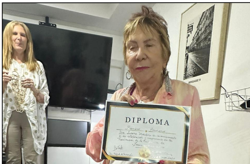
Foto de reconocimiento como miembro honorario del Seminario Psicoanalítico de Tucumán

He sido reconocida en el Seminario Psicoanalítico de Tucumán Miembro Honorario por mis participaciones como ponente en los congresos que organiza la institución en Río de Janeiro (Brasil), en el Museo