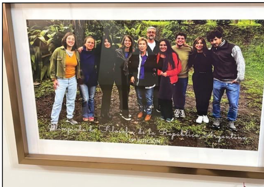
Edición número 19º de la Olimpiada de Filosofía. Instancia Final en Horco Molle (UNT).

El objetivo del libro era reflexionar, desde un punto de vista legal y filosófico, sobre el rostro positivo y negativo de la Inteligencia Artificial y remarcar al cine como precursor