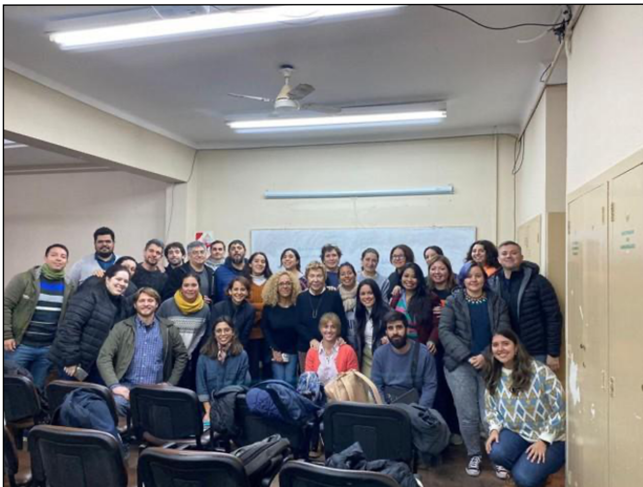
Clase dictada en el Doctorado en Humanidades sobre Los desafíos actuales del Humanismo entre el 2 al 4 de diciembre de 2024.